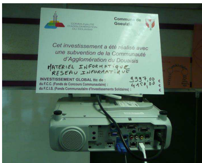
Finalisation de l'investissement des rétroprojecteurs, équipant l'ensemble des classes de l'école Mireille du Nord.