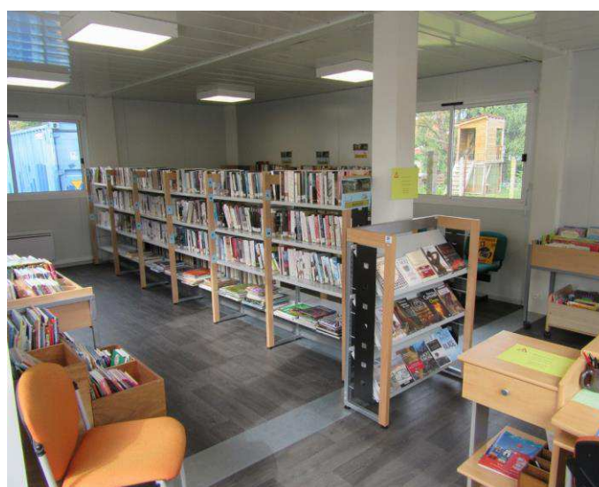
Nouvelle bibliothèque vue de l'intérieur