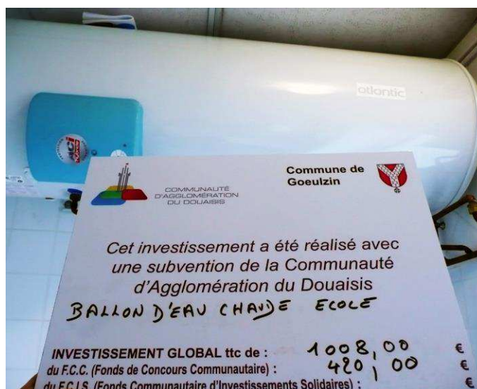
Nouveau ballon d'eau chaude pour l'école Mireille du Nord.