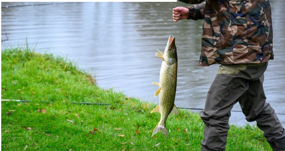
Belle prise lors du concours au brochet le 12 décembre 2020.

La société de pêche La Gœulzinoise vous propose 6 concours, au marais de Gœulzin en 2021. Les concours sont ouverts à tous. Les cannes sont limitées à 10 m et les lignes à 3 m. Tarif : 5 euros.