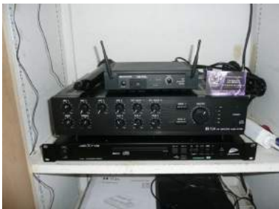
Achat d'une nouvelle sono