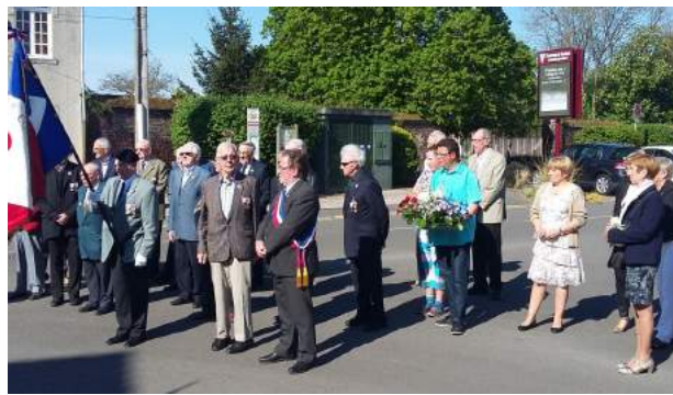
08 MAI 2016