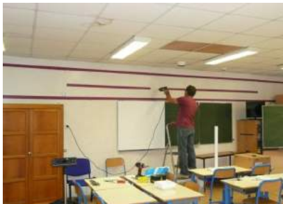
Installation de 2VPI (Toute l'école est équipée de VPI + ordinateur portable)