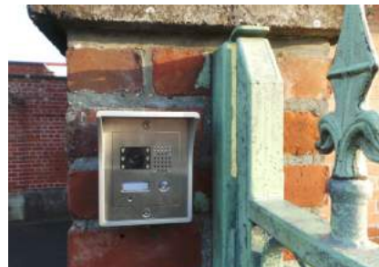
Sécurisation des entrées dans l'enceinte de l'école (vidéo)