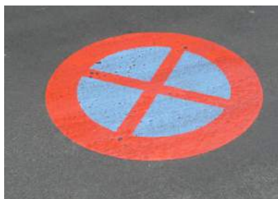
Marquage au sol à proximité de l'école Mireille du Nord