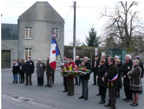
GUERRE D'ALGERIE - 18 MARS 2016