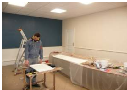
Rénovation de la salle des cérémonies et de l'accueil de la Mairie