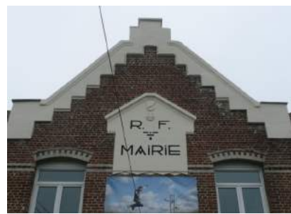
Rénovation du fronton de la Mairie