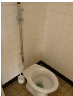
Rénovation des sanitaires