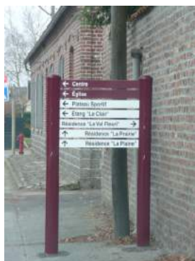
Installation de panneaux directionnels